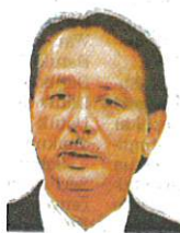
Dr Noor Hisham Abdullah

dengan kebolehjangkitan COVID-19 di negara ini, iaitu 1,047 kes sedang dirawat di unit rawatan rapi (ICU) dengan 520 kes masih memerlukan alat bantuan pernafasan," katanya dalam kenyataan semalam.