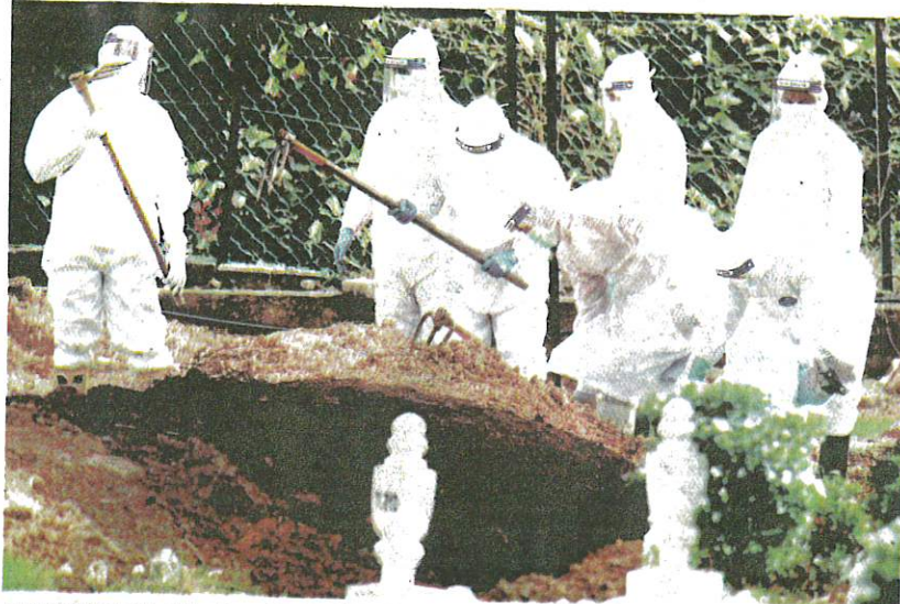
PETUGAS Pejabat Kesihatan Daerah Melaka Tengah dibantu Angkatan Pertahanan Awam Malaysia menguruskan jenazah pesakit Covid-19 di Tanah Perkuburan Islam Bukit Baru Melaka semalam.

Ketua Pengarah Kesihatan, Tan Sri Dr. Noor Hisham Abdullah berkata, daripada jumlah kes harian semalam, sebanyak 298 kes (1.5 peratus) kategori tiga, empat dan lima, manakala 19,442 kes (98.5 peratus) kategori satu dan dua.