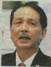
DR NOOR HISHAM

Beliau berkata, empat lagi negeri yang mencatatkan kes baharu Covid-19 empat angka adalah Kuala Lumpur dengan 1,360 kes; Pulau Pinang (1,251); Kelantan (1,227); dan Melaka (1,120).