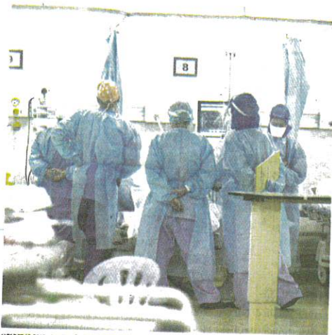
SEKUMPULAN doktor memantau seorang pesakit Covid-19 di Wad Isolasi Jabatan Kecemasan dan Trauma di Hospital Kuala Lumpur (HKL), semalam.