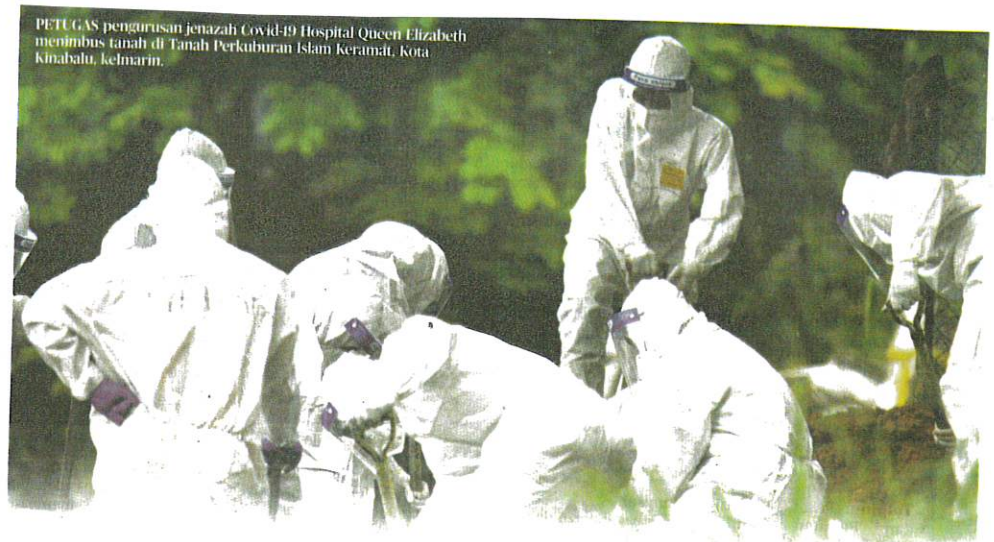
PETUGAS pengurusan jenazah Covid-19 Hospital Queen Elizabeth memimbis tanah di Tanah Perkuburan Islam Keramat, Kota Kinabalu, kelmarin.